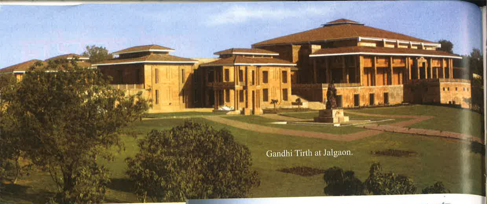
Gandhi Tirth at Jalgaon.