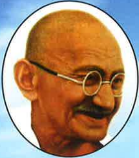
Gandhiji's autobiography in Konkani

Nilesh Aavish Shah / Kishore GRF News cutting Cover - 2 P-13 to 15