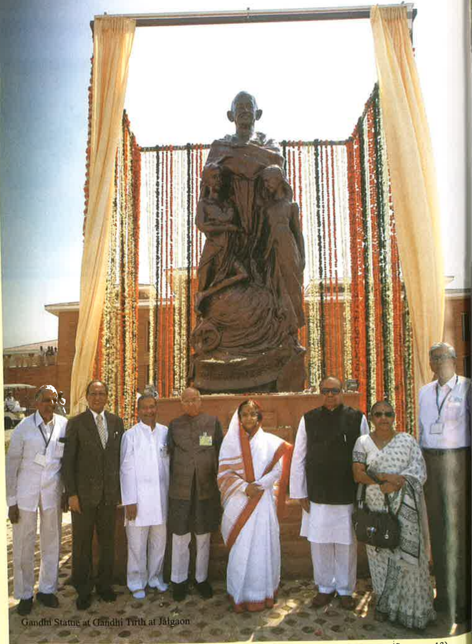
Gandhi Statue at Gandhi Tirth at Jalgaon